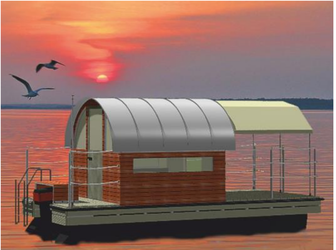
Perebo-Flösse PH10 Serie